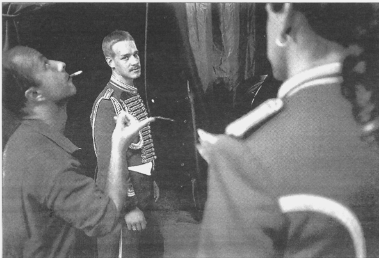
Fotografía de Javier Lasén Pellón incluida en su libro 'Días de circo'.

Como señala el fotógrafo Koldo Chamorro en su texto introductorio, cualquier lector siempre elige su imagen particular entre una colección coherente de imágenes. Cada cual,